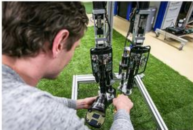
Maschinenbau/Mechanical Engineering (MME)