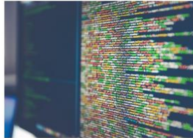
Power and Data Engineering (PDE)